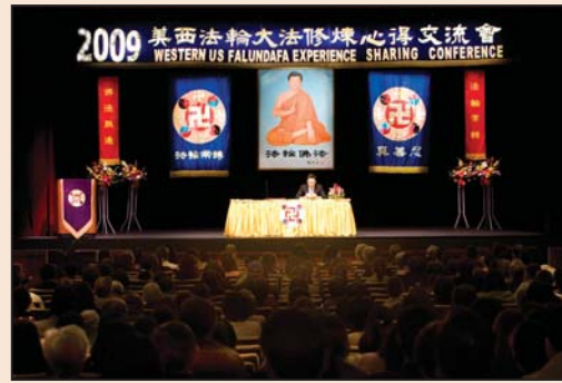
零九年美西法会 回顾十年修炼路 (第四版)