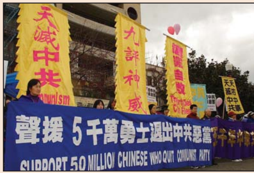
写在五千万中国人三退之际 (第三版)