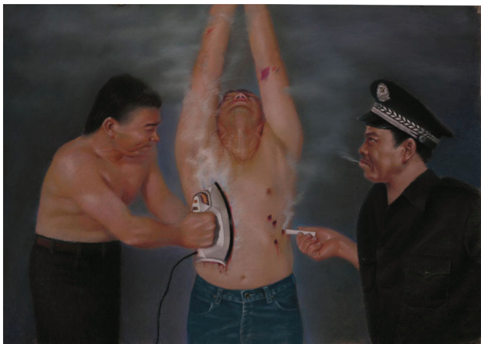
图：酷刑重组：火烫（绘画）