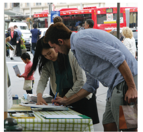
图：悉尼市政府大楼前，人们签名呼吁彻查中共活摘器官的罪行

这位丹麦人被感动了，他一边签名一边说：“我支持你们。活体摘取信仰者的器官，这简直太残酷了，比当年纳粹杀害犹太人还残忍。揭露他们，敦促联合