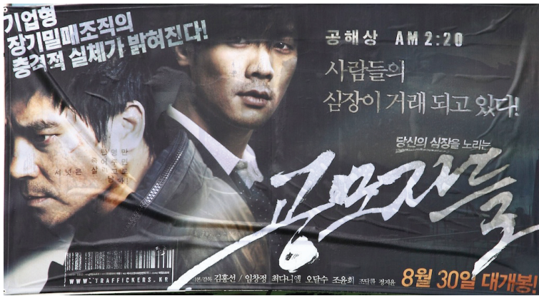
图：一部揭露中共活摘器官的韩国电影《同谋者们》

实际上《同谋者们》披露的仅仅是中共活摘器官的冰山一角，更大量且更惨烈的犯罪事实，早已在被非法关押的法轮功学员身上发生着。二零零六年三月初，中共在苏家屯等集中营活体摘取法轮功学员器官以牟取暴利并焚