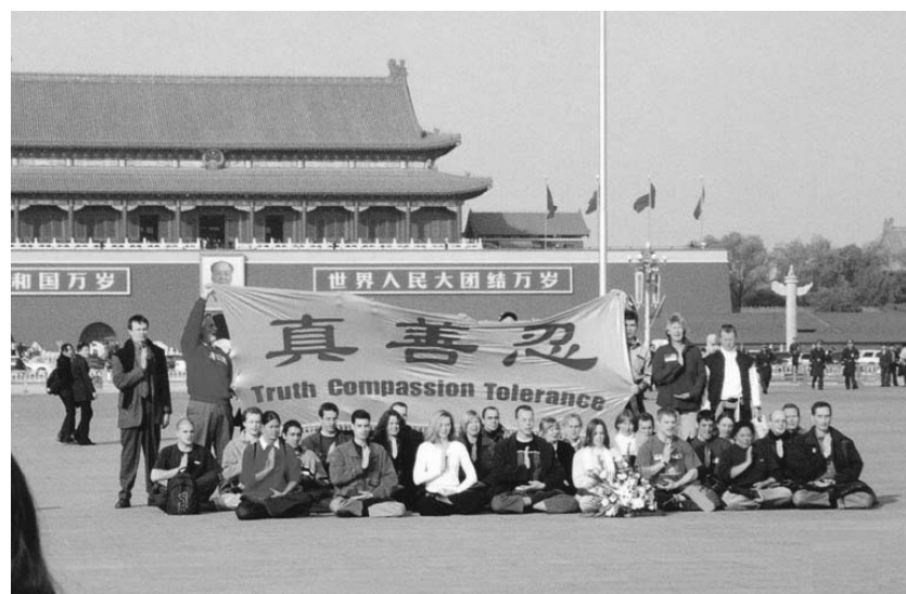
图：三十六位西人法轮功学员在天安门广场抗议中共对法轮功的迫害

中共历次政治运动，受迫害者没有谁能挺得过几天，可是法轮功学员却不屈不挠的走过了十三年！在中共迫害前，法轮功在中国和海外就已有深远的影响，经过十三年的反迫害，法轮功越发强大，法轮功的著作被译成三十多种语言，法轮功弘传到一百多个国家和地区。这不能不说是一个奇迹。