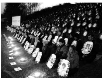
图：欧洲法轮功学员悼念被迫害致死的同修

的名单中包括老人、孕妇、少女，他们中有你的乡亲，有你的同行、有你的校友、甚至亲戚……仅仅因为不愿放弃信仰——一个公民的基本权利，他们被身穿制服的所谓“执法人员”抓捕。他们在心跳终止之前，有的经历了“执法人员”直接或间接长达几小时的电击，有的经历了形形色色的手铐、脚镣、“烟杆铐”、“狼牙