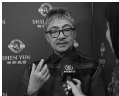
图：印尼国际知名时装设计大师哈利·达索诺博士

衷感到自豪。总部在美国纽约的神韵艺术团，经过短短6年时间，巡回演出全世界上百个城市，通过超凡的舞台艺术表演，让东方、西方不同族裔、不同阶层的观众亲身体验中国五千年的传统文化的精髓，让东方古典艺术所呈现的纯善、纯美打动千百人的内心。