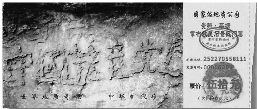
图：昭告中国人的天意：贵州省平塘县国家级地质公园一块大石头上天然形成的“中国共产党亡”六个大字历历可观。图为公园门票。

上天在恒定一切，迫害善良就是对邪恶的纵容。重复的历史一再告诫着行恶之人：如果不停止行恶，那最终的命运历史早已写好。