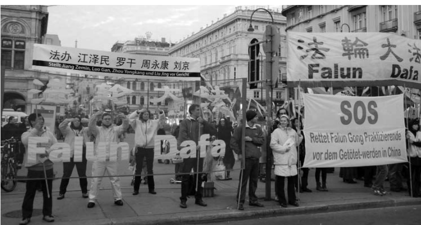
图：法轮功学员在卡拉扬广场抗议中共迫害

十月三十日致十一月一日中共党魁胡锦涛到访奥地利期间，当地法轮功学员举行了和平抗议活动，谴责中共对法轮功的迫害，呼吁惩治迫害法轮功的元凶江泽民、罗干、刘京、周永康，责令中共立即释放被非法关押的法轮功学员。