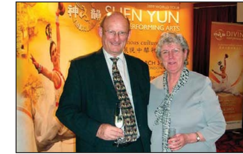
图：上议院议员彭罗斯勋爵和夫人

的法官，负责法院独立于政府的干预，行使其裁决权。对于中国文化，麦凯先生表示，“我去过中国很多次，参观过西安、北京长城，也观看过中国表演，但今晚能看到