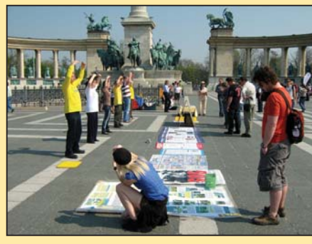
布达佩斯英雄广场炼功 (第四版)