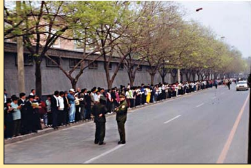
一张图片明真相：围攻还是上访？ (第三版)