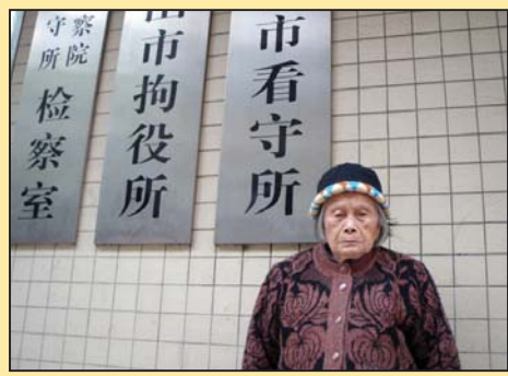
百岁老人要求释放被劫持的孙女 (第二版)