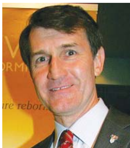
图：布里斯本副市长阔克连续三年观赏神韵演出

伦·格如米特 (Allen Grummitt) 偕同妻子以及朋友一起观看了演出，他表示从来没有见过这样水准的表演，绝对称得上是卓越的演出，令他相当感动，“演出非常的好，确实非常之好，我都喜欢。还有色彩，服装的色彩感真是太壮观了。”