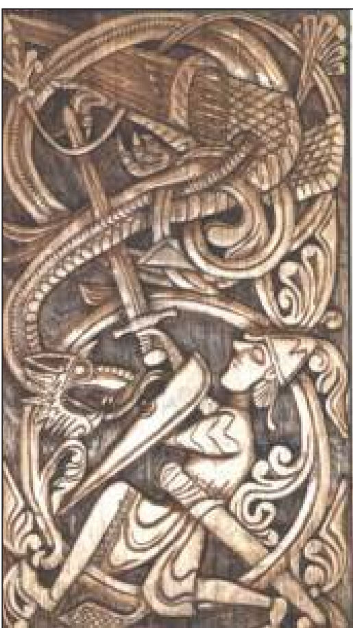
图: 维京人Hylestad教堂木门上的雕刻作品“Sigurd the Dragon-Slayer”