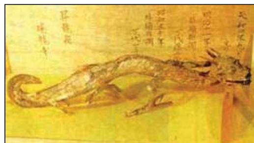
图: 收藏于日本大阪瑞龙寺的龙化石。现存日本大阪市浪速区瑞龙寺,据说于三七〇年前,由中国传至日本,全身覆有鳞片,眼睛巨大,头长四角,嘴边垂下两条长须,长有锯子般锐利牙齿的大口,与恐龙般的背脊,龙身一公尺

在著名的秘鲁纳兹卡(Nazca)平原北部有一个被称为ICA的小村庄附近的小山中,有一批雕刻着图案的石头在几年前ICA河决堤时,被人们大量的发现。其中有的石头上清晰的雕刻这人与恐龙在一起。