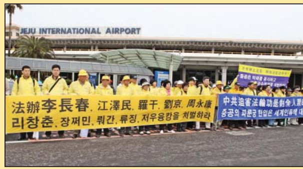
韩国法轮功学员在李长春访问期间抗议迫害 (第六版)