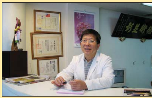
炼法轮功的人真好 (第四版)