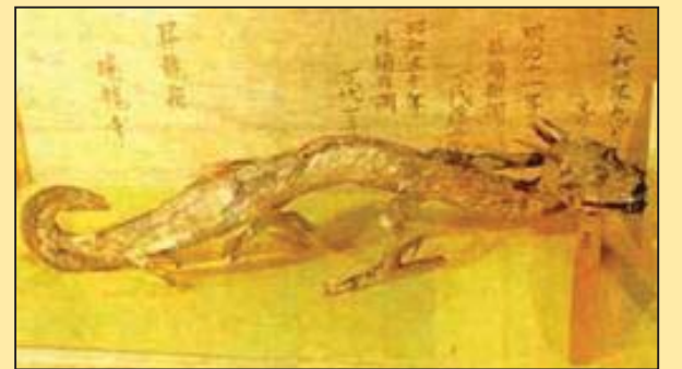
神话生物的现实版 (第八版)