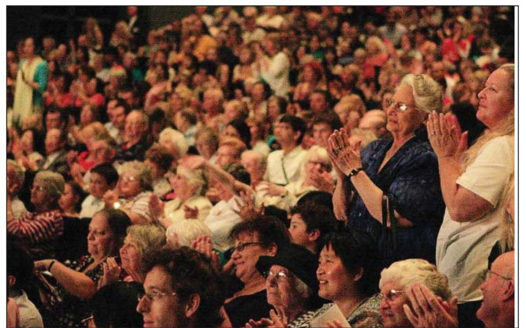
图：堪培拉观众为神韵的精彩演出而陶醉

赛尔维九十多岁的母亲因年事已高，许多事情都会忘记，但却不会忘记神韵演出，已经连续三年