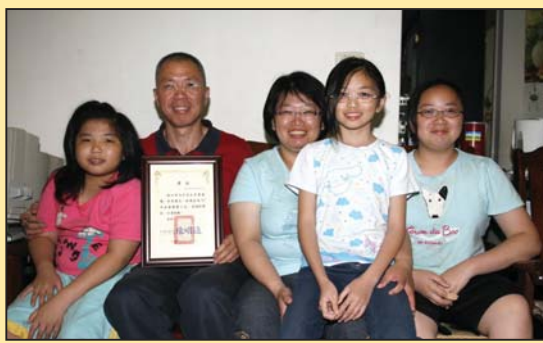
火爆浪子转变为绩优员工 (第四版)