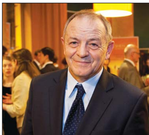
图：波兰众议院议员费德洛维奇先生

波兰国家银行执行总裁布鲁斯基 (Jerzy Pruski) 和妻子祖兰塔 (Zolanta) 观看了神韵演出。他们对记者表示，演出与众不同，是个非常有趣的文化盛事。妻子祖兰塔是波兰国家银