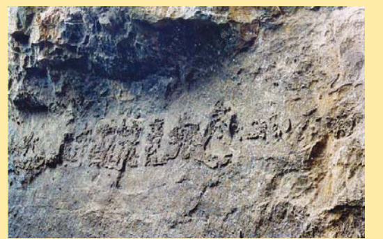
石头说话了 (第八版)