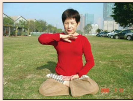
大法给我第二次生命 (第四版)