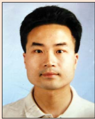
蓝兵在上海监狱遭迫害 (第一版)