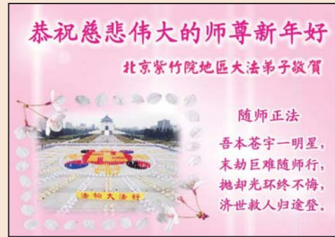
世界各地大法弟子恭祝师尊新年好 (第四版)