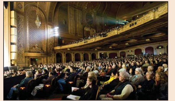
“神韵回答了人类永恒的问题” (第八版)