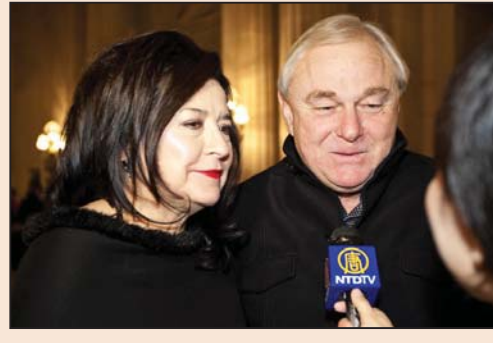
硅谷公司总裁：我们真的获益良多(第七版)