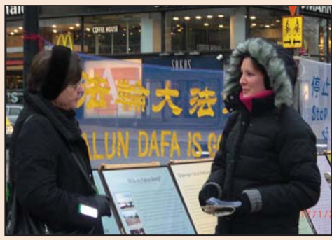
寒冬中坚持讲真相 感动芬兰民众(第六版)