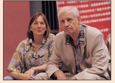
特异功能是真的吗？(第八版)