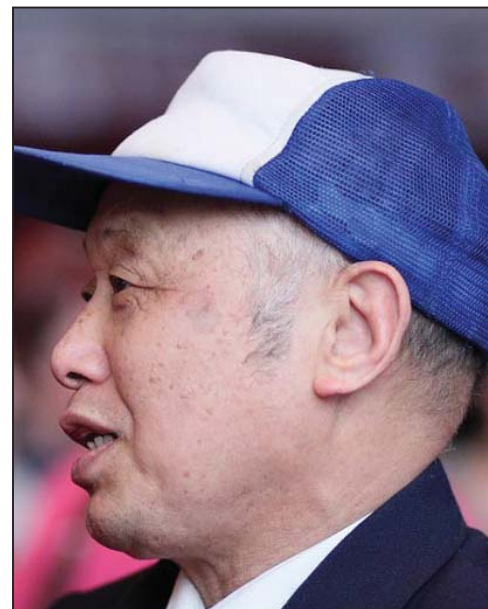
图：中国大陆流亡作家陈沅森