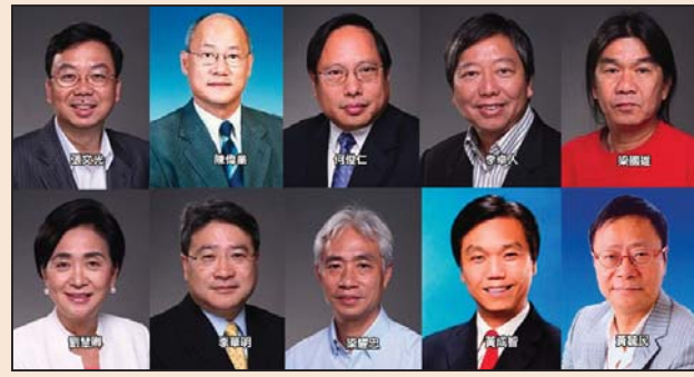
支持新唐人 香港十议员联信法总统(第六版)