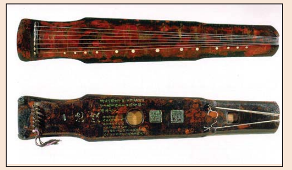
师旷琴艺通神(第八版)