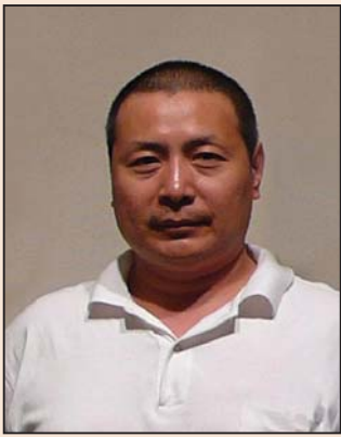
北京画家、摄影家 被非法劳教(第一版)