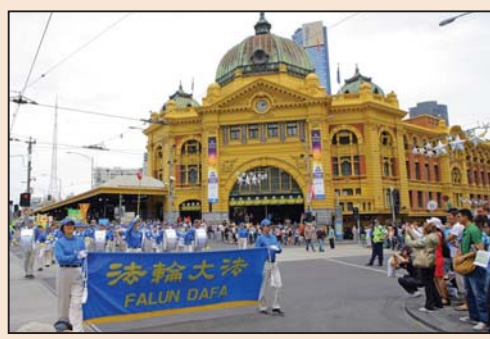
墨尔本新年大游行(第四版)