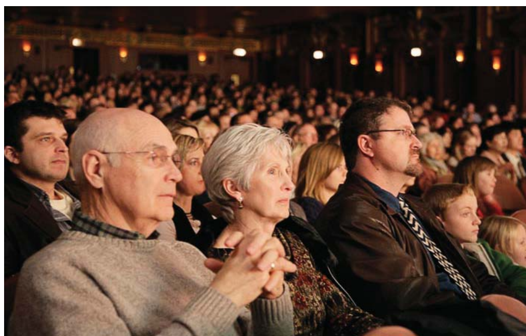
北卡观众聚精会神地观看神韵演出

她进一步表示，天幕与舞台表演完美地融合，节目中山景与布景的设计还久久萦绕脑海中，