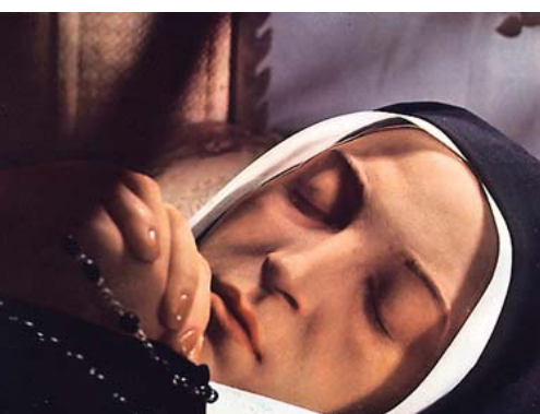
修女圣白娜戴特的面容历经百年仍栩栩如生