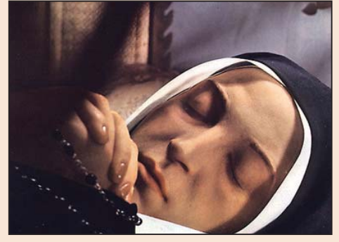
去世百年的鲜活面容(第八版)