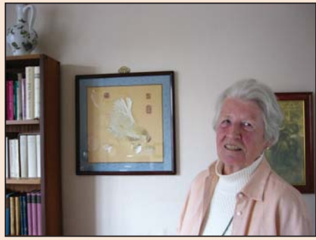
欧洲最年长的法轮功女学员(第四版)