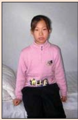
爸爸被迫害致死 九岁女儿喊冤(第六版)