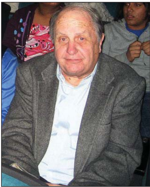
托马斯·古德奈特教授

为例，说明“神的启示”是传统中国文化的主题之一。古德奈特说，在西方十八世纪的诗歌中，还有类似的“神启”主题，可是在现代西方文化艺术中，已经难以找到这样的主题。