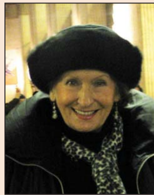
歌剧院老板： 胜过帕瓦罗蒂(第七版)