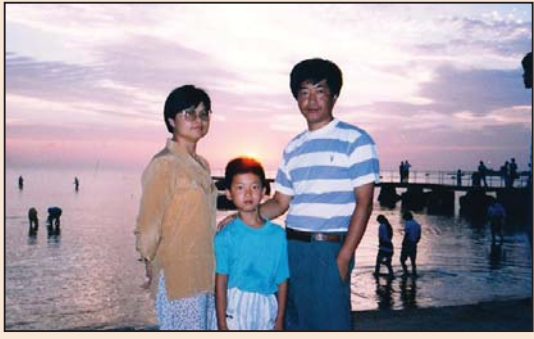
投诉石家庄新华区法院执法犯法 (第二版)