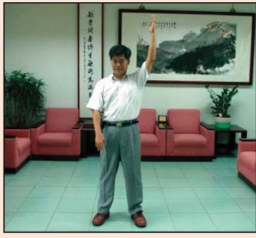
第一名的校长 (第四版)