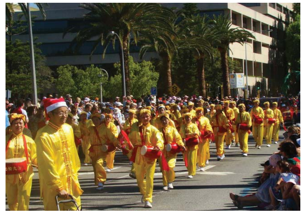
澳洲柏斯市年度圣诞节大游行

法轮功学员受到酷刑虐待甚至被活摘器官的情况进行调查，并要求对参与迫害的责任人绳之以法。委员会还建议：中共应该立即采取措施禁止全国范围内的酷刑和虐待；中共应该立即废除所有形式的行政拘留，其中包括劳教；中共应当确保没有人被关在任何秘密的拘留中心；中共应该废除所有的禁止律师独立性的法令，并调查所有对律师和原告的攻击；中共应该立即采取措施调查所有恐吓律师进行独立操作的行为。